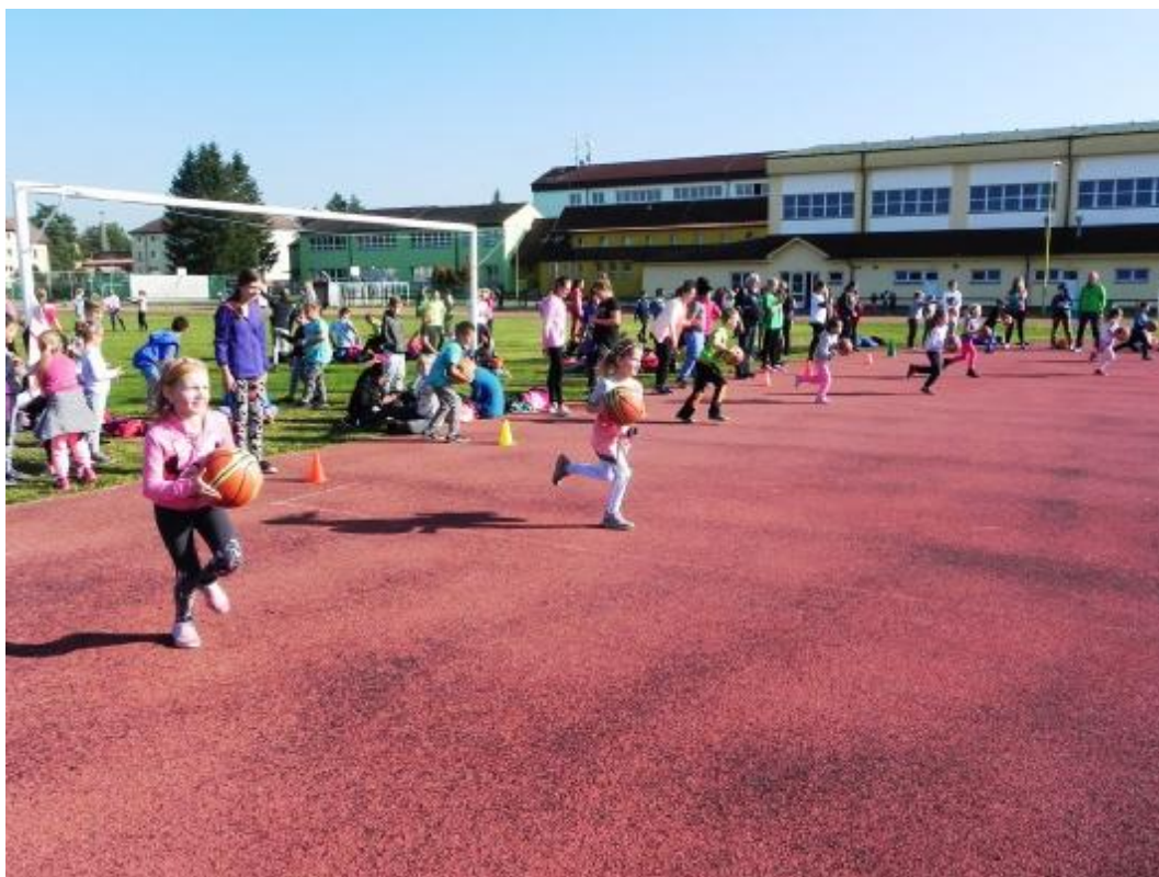
Závody v přespolním běhu