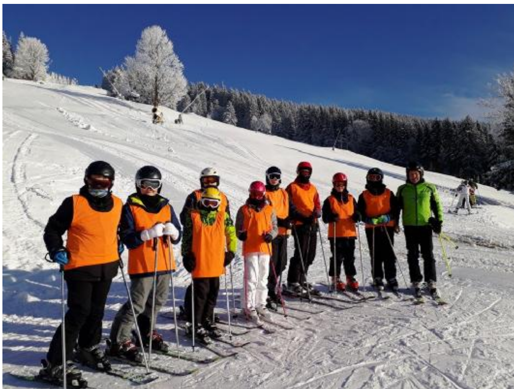
Návštěva hejtmana Libereckého kraje